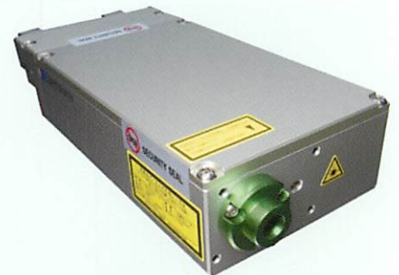
超小型グリーンレーザ「LVE-G0300」